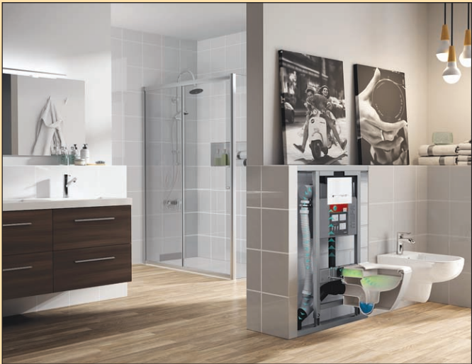
Mit dem Air-WC gehören schlechte Gerüche der Vergan- genheit an, da sie gar nicht erst in die Umgebungsluft ge- langen.

epr - Ein Ort zum Entspannen, Wohlfühlen und Pflegen – in- kaum einem Raum nehmen Sauberkeit und Frische eine so besondere Stellung ein wie im Badezimmer. Damit wir uns je- den Tag über den eigenen Well- ness-Tempel freuen können, ist eine gute Luftqualität unerläs- lich. Doch schlechte Gerüche, die meistens in und knapp über der WC-Keramik entstehen, trüben das Klima. Die MEPA – Pauli und Menden GmbH bie- tet mit dem Air-WC Element, einem integrierten Lüfter im Spülkasten, eine innovative Produktlösung. Völlig unsicht- bar in das Vorwandssystem eingesetzt sorgt er für Frische, indem die verunreinigte Luft über das Spülrohr durch den