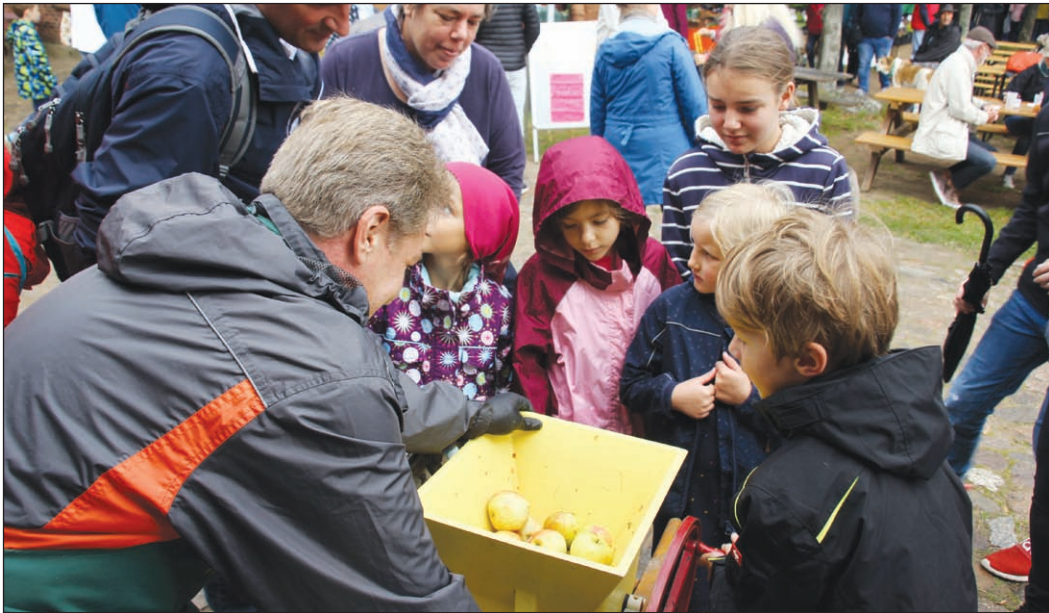
Das Apfelsaftpressen war eine beliebte Mitmach-Aktion für Kinder. Der selbstproduzierte Apfeldrink war bei den Besuchern sehr begehrt und schmeckte allen.

Schönberg (rr) Groß war das Interesse am diesjährigen Herbstmarkt auf dem Gelände des Probsteimuseums.