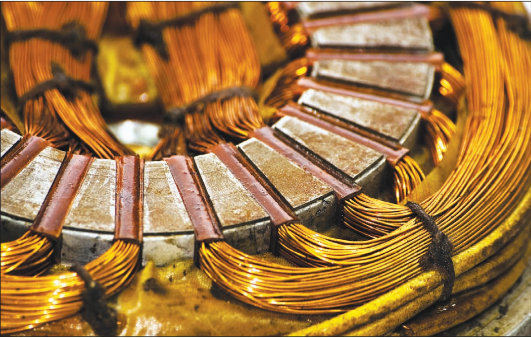
Kupfer spielt eine wichtige Rolle in fast allen Techniken zur Gewinnung von erneuerbaren Energien, zum Beispiel in den Wicklungen von Stromgeneratoren.

Elektrischer Strom spielt eine Hauptrolle in der Energiewende. Wenn er aus erneuerbaren Quellen stammt, ist er klimaneutral. Damit er sauber und bedarfsge-recht verfügbar wird, sind noch große Anstrengungen erforderlich. Energiesparende Techni-