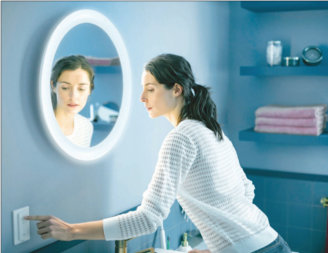
Der warme Lichtschein von dem Lichtrezept „Entspannen“ ist die perfekte Einstimmung auf die bevorstehende Nachtruhe.

epr - Um sich im Badezimmer so richtig wohl zu fühlen, bedarf es einer Lampe, die mehr kann, als einfach nur „Licht machen“. Die passende Beleuchtung für jeden Besuch im Bad bietet die Philips Hue Adore Kollektion, zu der eine Decken-, eine Wand- und eine Spiegelleuchte sowie ein ler, 2er, 3er und ein runder 3er Spot gehören. Dank vier vorde- finierter Lichtrezepte kreieren sie ganz bequem die richtige At- mosphäre für jeden Moment. So