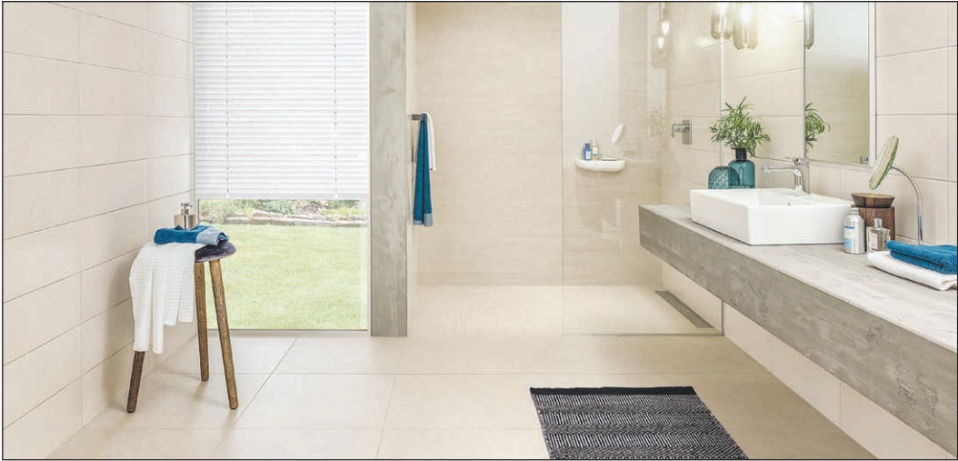
Eine bodenebene, verflieste Dusche vergrößert das Bad optisch; verstärken lässt sich dieser Effekt durch die harmonisch abgestimmte Wand- und Bodengestaltung mit modernen XL-Fliesen im Natursteinlook.

djd - Ein bodenebener, großzü- oben auf der Wunschliste. Da- giger Duschbereich ist im Neu- für gibt es mehrere Gründe: Bo- bau heute fast Standard. Und er dengleiche Duschbereiche sind steht auch bei Haus- und Woh- schwellenlos, das macht sie bar- nungsbesitzern, die eine Bad- rierefrei und komfortabel. Da modernisierung planen, weit es gegenüber herkömmlichen