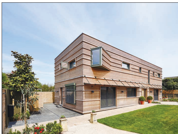
Moderne Architektur, altbewährter Baustoff: Die Fassade dieses Hauses ist mit naturbelassenem Holz verschalt.