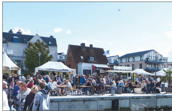
Kunst und Kreatives rund um den Hafenplatz.

designern aus den verschiedensten Materialien, z.B. Gold, Silber, Mineralien, Edelstein, Bernstein, Holzschmuck. Glasperldrehen wird auch als Vorführung gezeigt, vielfältigstes Textildesign aus Leinen, Wachs, Walk, Strick, Hüte und Mützen werden angeboten. Edle Lederkunst, dann Papier- und Buchbindearbeiten, Bücher, Briefpapiere und Karten, Bilder und maritime Fotografien, Stempel, Tiffany, Stahlfackeln, Schmiedearbeiten, Steinobjekte für Haus und Garten, Glasobjekte, schöne gedrechselte Dinge aus Holz, Tonflöten, Keramikarbeiten, Windspiele und viele andere dekorative Sachen.