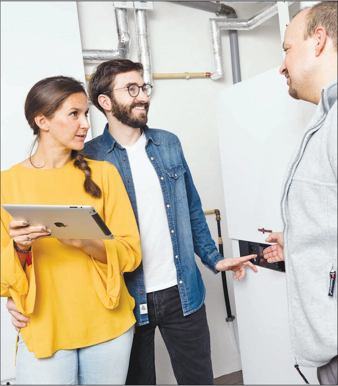
Herzstück einer modernen Heizungsanlage kann eine effiziente Brennwertheizung sein.

Als Faustregel gilt: Verrichtet die Heizung seit 20 Jahren oder länger ihren Dienst, ist es in der Regel sinnvoll, sie gegen ein jüngeres Exemplar auszutauschen. Und das ergibt Sinn: Egal, ob Öl oder Gas, wer auf moderne Brennwerttechnik setzt, senkt damit seinen Energieverbrauch und somit auch den CO2-Ausstoß um bis zu 30 Prozent. Bundesweit entsprechen fast zwölf Millionen Gas- und Ölheizungen nicht mehr dem Stand der Technik und verbrauchen zu viel Energie. Steht eine veraltete Ölheizung im Keller, sei eine Modernisierung mit Öl-Brennwerttechnik im