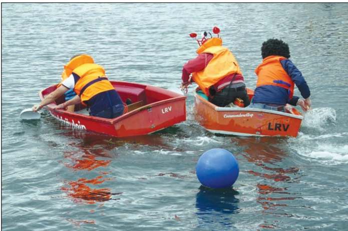
Gute Koordination war beim Bratpfannenrennen gefragt.