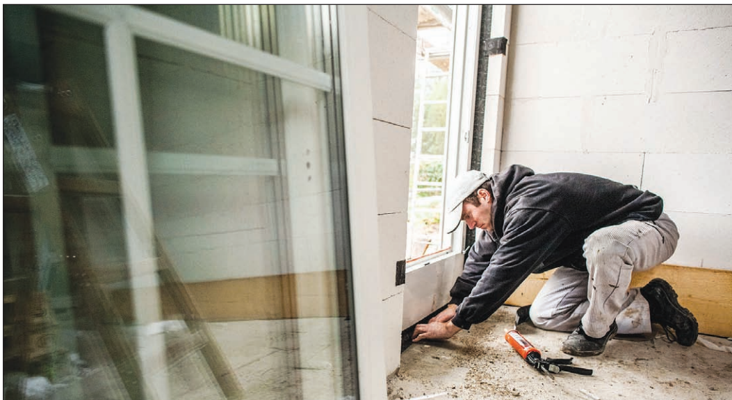
Fenster und Türen spielen eine wichtige Rolle für Energieeffizienz und Sicherheit im Eigenheim.

djd - Die Fenster spielen in jedem Haus eine wichtige Rolle. Sie lassen Licht und Luft ins Haus, zugleich schützen sie es vor Wind, Regen und Kälte sowie vor Abgasen und Lärm. Weil alte Fenster die gestellten Anforderungen oft unzureichend erfüllen, lohnt es sich, gegebenenfalls über einen Austausch nachzudenken. Moderne Isolierglasfenster können zum Beispiel gegenüber alten Einscheiben-Verglasungen bis zu 75 Prozent Heizenergie einsparen.