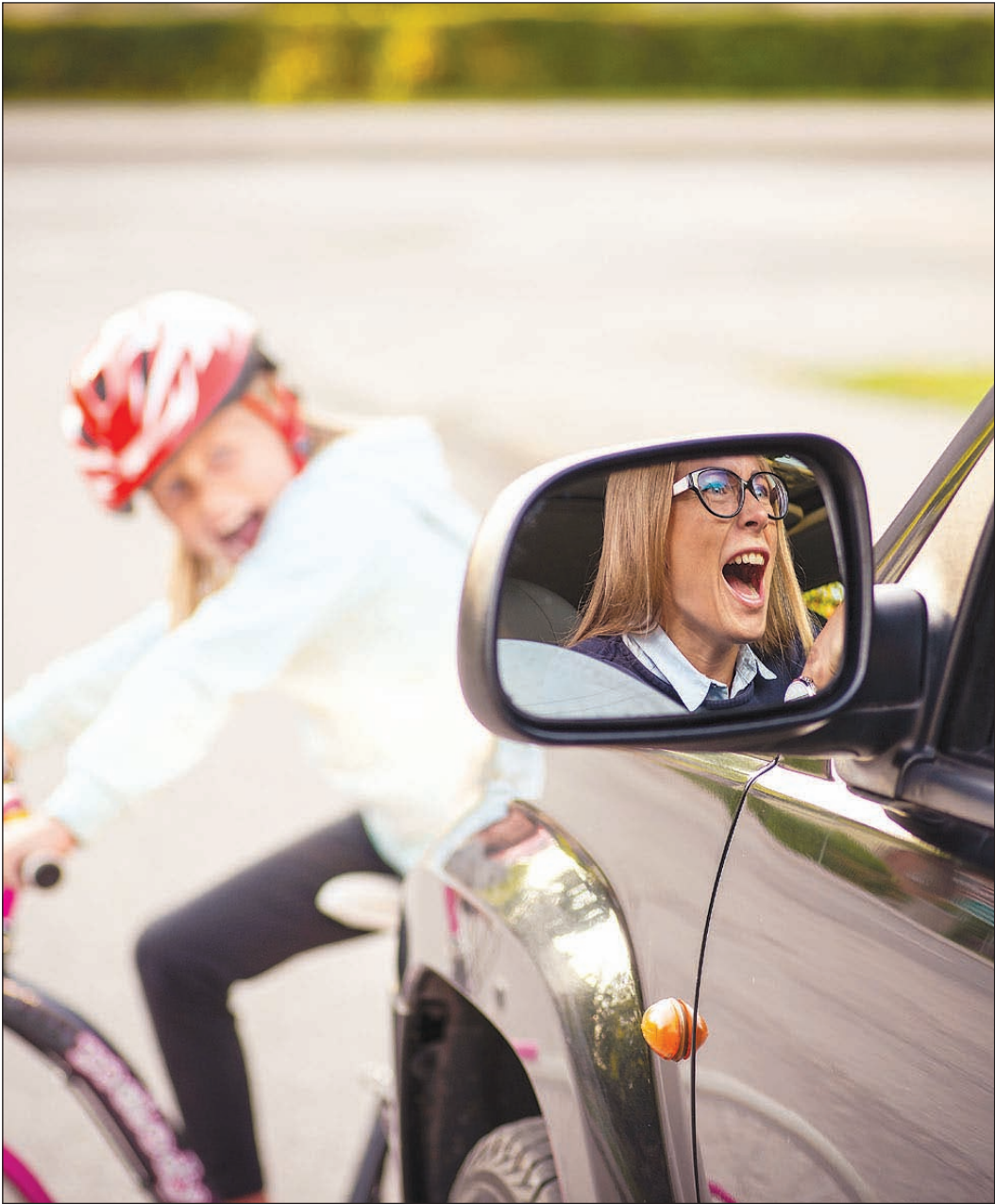
Schon fast jeder Autofahrer hat derartige Schrecksekunden erlebt. Technische Helfer wie ein Notbremsassistent können in Sekundenbruchteilen handeln und viele Unfälle verhindern.

djd - Ein unaufmerksamer Moment, Sekundenbruchteile zu spät reagiert - und schon kann es im Straßenverkehr zu fatalen Unfällen kommen. Viele davon lassen sich vermeiden, wenn die Technik den Menschen am Steuer unterstützt. Im Fall der Fälle können beispielsweise Notbremsysteme im Fahrzeug schneller reagieren und somit viele Personen- und Sachschäden vermeiden.