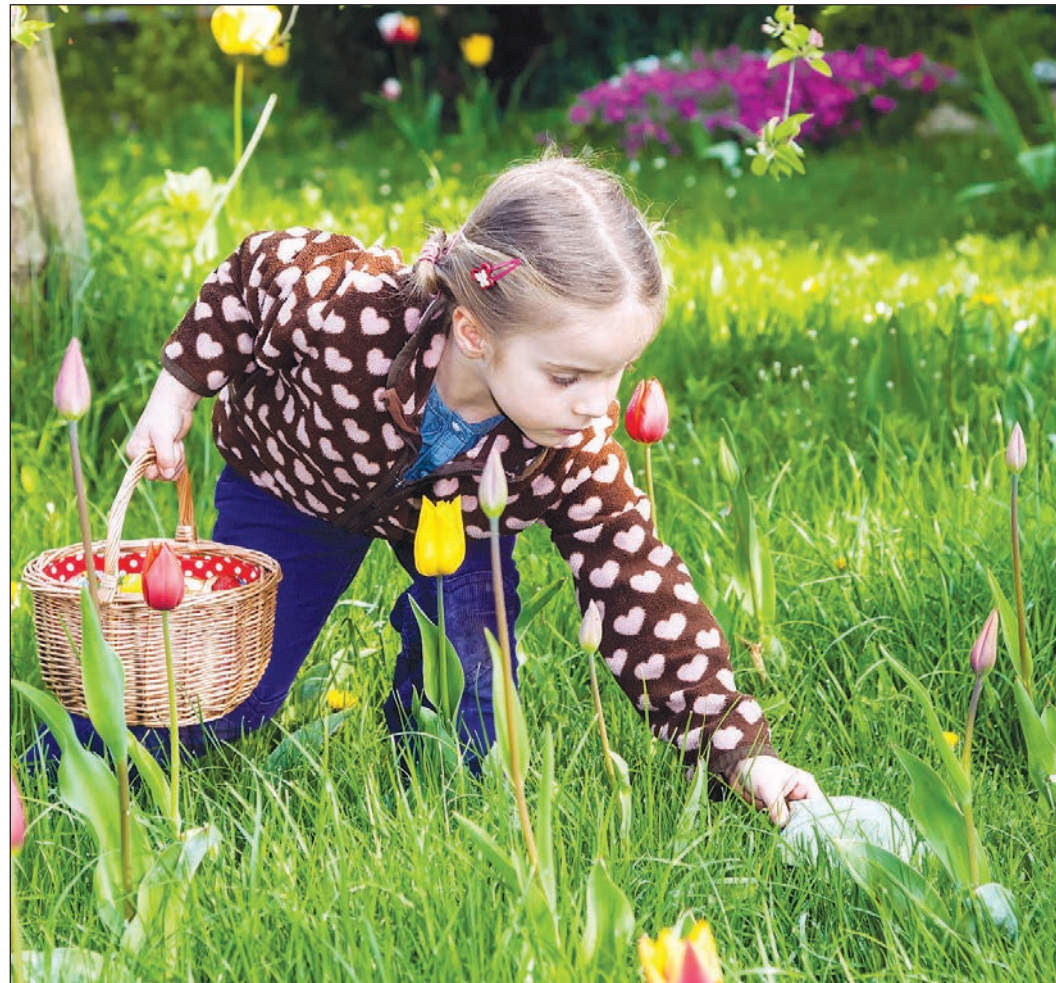
Was ist bloß im Garten versteckt? Für Kinder ist die Eiersuche an den Feiertagen jedes Jahr spannend.

Die traditionelle Eiersuche im Garten ist für Kinder das Highlight der Ostertage. Hier laufen die kleinen Spürnasen zur Hochform auf. Auch das kniffligste Versteck wird entdeckt, im Notfall mit ein paar gut sichtbar gelegten Spuren oder einem heißen Tipp von Papa und Mama. Hier kommen nicht nur hart gekochte Eier ins Körbchen. Auch ein größeres Ostergeschenk kann im Garten oder im trockenen Schuppen versteckt werden. Eine Kombination aus Schokolade und Spielspaß bietet etwa das kinder