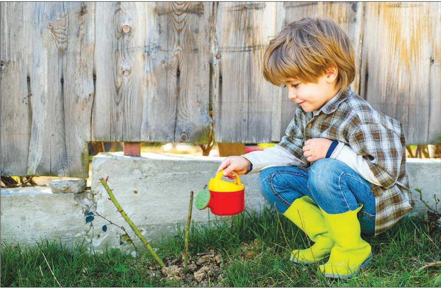
Im eigenen Garten kommt nie Langeweile auf.