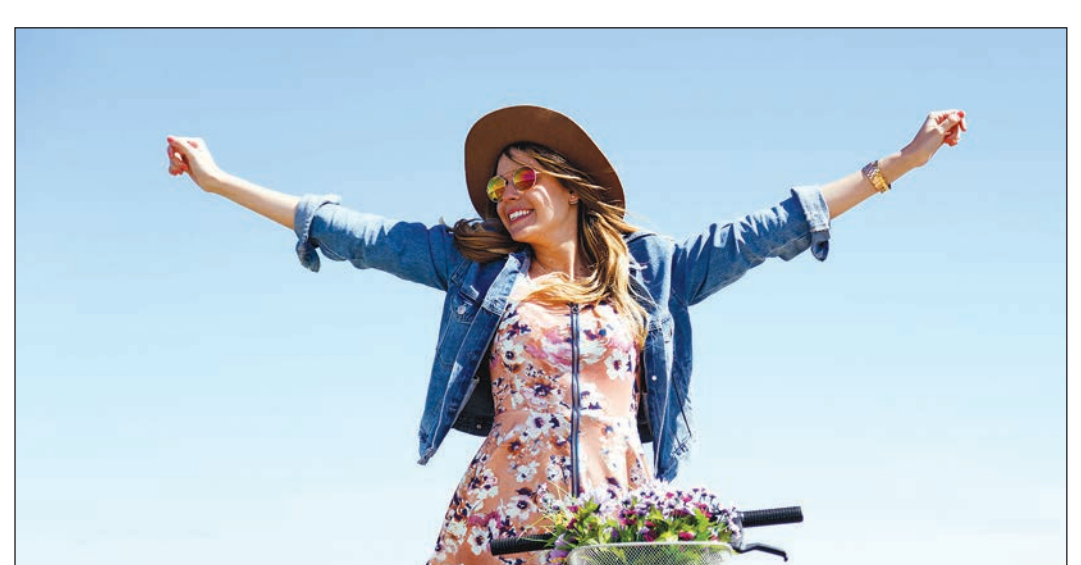
Creme mit hohem Lichtschutzfaktor, Hut und eine gute Nährstoffversorgung der Haut können vor Sonnenschäden bewahren.

Das führt zu Falten, Pigmentflecken und schlaffen Hautregionen – und kann zusätzlich