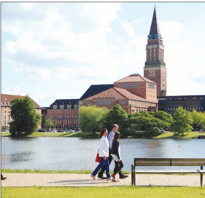
Eine fundierte Ausbildung bei der Landeshauptstadt Kiel.

Wer sich im Internet über die Ausbildungsmöglichkeiten bei der Stadt Kiel informiert, kann sich selbst von dem großen Spektrum der Ausbildungsplatzangebote überzeugen. Für jeden Schulabschluss ist etwas dabei. Vom Studiengang Bachelor of Engineering –Architektur bzw. Bauwesen, über Verwaltungsfachangestellte bis zu Industriemechaniker*innen findet man ganz unterschiedliche Angebote. Aktuell werden 226 Nachwuchskräfte in 17 Ausbildungsberufen und 4 Studiengängen ausgebildet. Auch eine Teilzeitausbildung ist bei uns möglich. Du bist kommunikativ? Bringst einen ordentlichen Schulabschluss mit? Und hast Lust, mit modernen Dienstleistungen für die Kie-