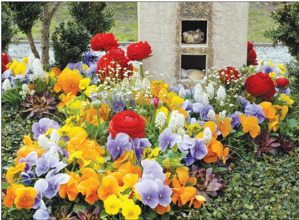
Bis es wieder richtig blüht, dauert es nicht mehr lange.