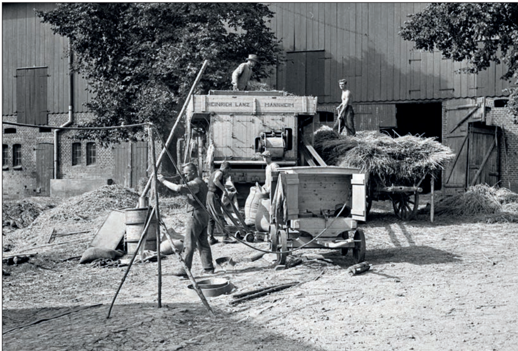
Foto: Theodor Möller (hfr), Dreschen bei Stoltenberg, 1939, Landesamt für Denkmalpflege

Schönberg - Pünktlich zum geplanten Saisonstart öffnet das Probstei Museum Schönberg seine Türen für Besucher und eröffnet gleichzeitig eine neue Sonderausstellung zur Kulturgeschichte der Probstei!