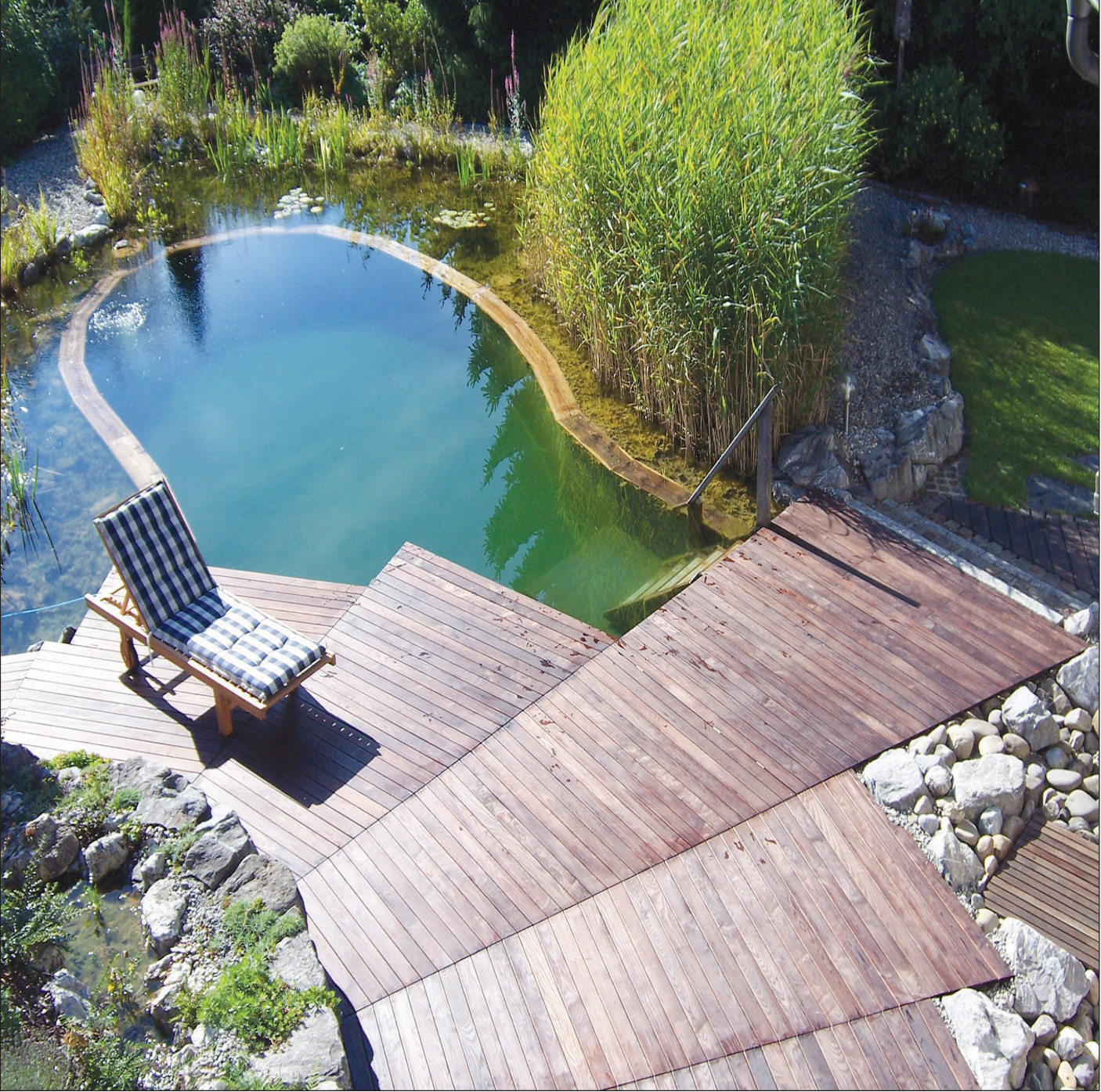
Das Naturmaterial Holz steht bei der Gartengestaltung hoch im Kurs. Für eine lange Lebensdauer braucht es eine solide Unterkonstruktion.

djd - Holz ist für viele Hausbesitzer bei der Gartengestaltung die erste Wahl. Nachhaltig und natürlich soll zum Beispiel die Terrasse wirken - sie erhält deshalb einen Belag aus massiven Holzdielen. Allerdings bringt der Baustoff aus der Natur auch so einige Besonderheiten mit. Er verwittert mit der Zeit, Wind und Nässe setzen dem Bodenbelag sichtbar zu, regelmäßige Pflegeanstriche sind notwendig.