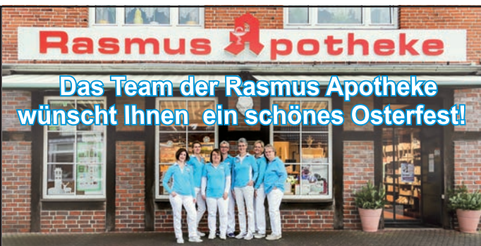
Rasmus-Apotheke, Quedensweg 1, 24248 Mönkeberg Tel: 0431/23 14 45, Fax: 0431/23 11 34

Tel: 04344 - 819 27 50 Wellness-bei-steffie.de