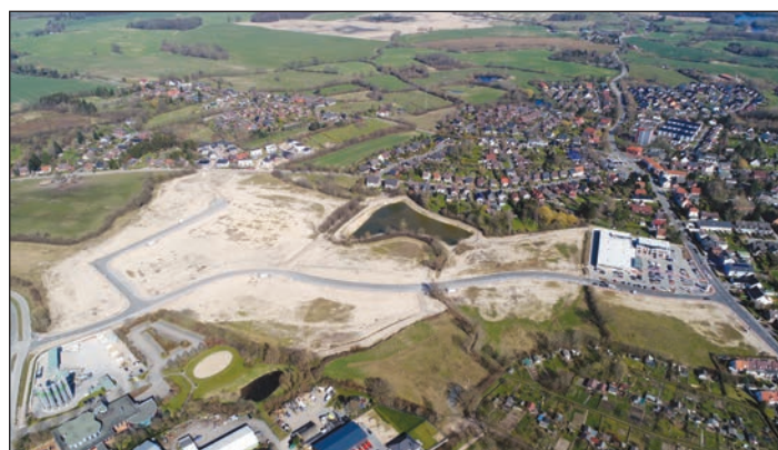
Die neue Verbindungsstraße durch das erweiterte Gewerbegebiet sorgt für eine erhebliche Entlastung des innerörtlichen Verkehrs in Schönkirchen.

14 Grundstücke sind im erweiterten Gewerbegebiet Söhren V bereits verkauft. Für acht weitere Gewerbeflächen würden laut Bürgermeister Gerd Radisch die nächsten Beurkundungen unmittelbar bevorstehen. Etwa 10,5 Hektar Gewerbeflächen werden seit gut einem Jahr in Eigenregie vermarktet. Mit den Neuan siedlungen von Handwerks- und Dienstleistungsbetrieben, mittelständischen Unternehmen aus dem Amt Schrevenborn, aus Kiel und dem Umland ist die Gemeinde Schönkirchen für die Zukunft sehr gut aufgestellt. Auch der Branchenmix stimmt. So werden sich neben klassi-