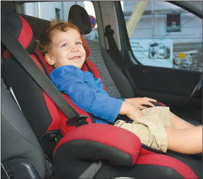
Für die Kleinsten ein gefährlicher Ort

DEKRA Info - Das Auto ist für Kleinkinder ein gefährlicher Ort: Im Jahr 2019 verunglückten auf Deutschlands Straßen 28.005 Kinder im Alter von unter 15 Jahren bei Verkehrsunfällen. Die Mehrheit davon (37,2 Prozent) kam dabei als Mitfahrer in einem Pkw zu Schaden. Bei den Kleinkindern bis 6 Jahre liegt dieser Anteil sogar bei 64,4 Prozent, im Grundschulalter zwischen 6 und 9 Jahren liegt der Wert bei 40,4 Prozent. „Damit Kinder im Auto optimal geschützt sind, müssen sie mit einem für sie geeigneten Rückhaltesystem ordnungsgemäß gesichert werden, und das auf jeder noch so kurzen Fahrt“, sagt Markus Egelhaaf, Unfallforscher bei DEKRA. Laut Weltgesundheitsorganisation verringert sich durch den richtigen Gebrauch eines geeigneten Kinderrückhaltesystems die Gefahr eines tödlichen Unfalls um 70 bis 80 Prozent. In Deutschland dürfen Kinder bis zum Erreichen einer Körpergröße von 1,5 Metern oder bis zum vollendeten 12. Lebensjahr nur im passenden Kindersitz mitfahren. Dazu muss ein Sitz passend zum Gewicht des Kindes aus fünf