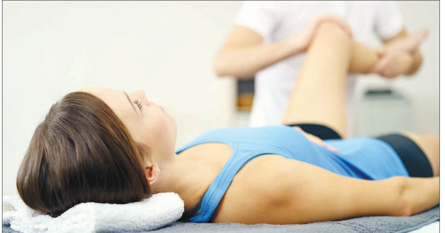
Bei einer osteopathischen Behandlung werden Blockaden und Fehlfunktionen mit den Händen erspürt und sanft behoben.