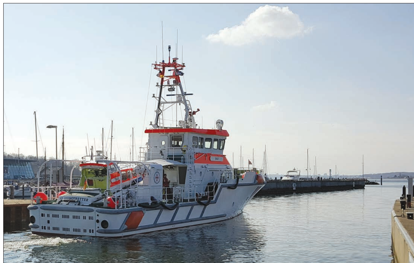
Immer ein Hingucker, die Seenotrettungskreuzer der DGzRS: Hier starten die „SK41“ mit dem Tochterboot „TB45“ im Huckepack ab Laboe zu einer ruhigen Bewegungs- oder Testfahrt. Im Einsatzfall stehen der SK41 zwei Motoren und 4.000 PS zur Verfügung.