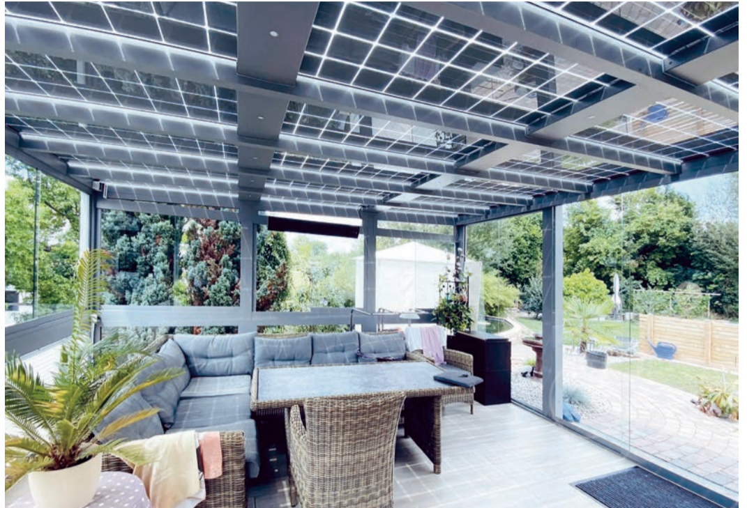
Eine Terrassenüberdachung ausgestattet mit Solarmodulen spendet gleichzeitig Schatten und Strom für das eigene Zuhause

Leistungsstarke Module verwandeln das einfallende Sonnenlicht in elektrischen Strom für die eigenen vier Wände. Nicht benötigter Überschuss kann verkauft oder über einen Speicher für einen späteren Zeitpunkt aufbewahrt werden – bis zu 90 Prozent können die Stromkosten damit reduziert werden. Ob über Eck oder als Holz- oder Alu-Konstruktion, die Solarterrasse ist der ideale Schattenspender, ohne dabei Tageslicht im Innern zu nehmen. Designstark passt sie sich jedem Hausstil an. Auch Carport, Balkon oder Zaun können mit den Solarmodulen ausgestattet und zur „E-Tankstelle“ für das eigene Zuhause werden