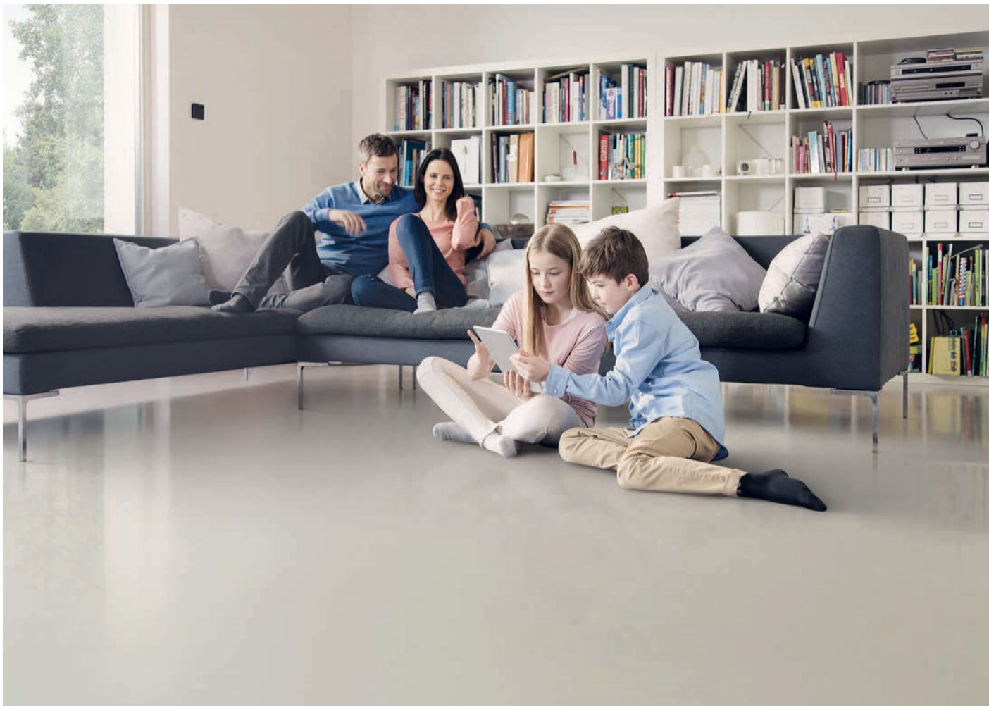
Im Wohnzimmer sollte der Fußboden tagsüber schön warm sein. Nachts darf die Temperatur etwas absinken

djd Das Energiesparen ist derzeit ein Top-Thema: Bei einer forsa-Umfrage im Auftrag der dena 2022 rechneten gut 74 Prozent der über 1.000 Befragten