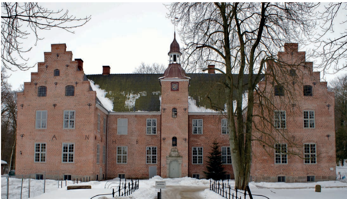
Das Herrenhaus Hagen bietet einen passenden Rahmen für viele, interessante Vorträge