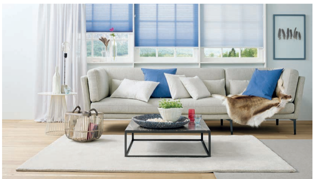
Natürliche Materialien wie Holz oder Kork fördern ein gesundes Raumklima

Den Bodenbelag Linoleum kennen viele noch aus ihren