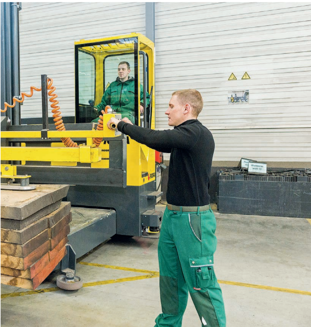
Die Auszubildenden im Holzfachhandel erhalten eine vielfältige und fundierte Ausbildung mit hohem Praxisbezug

djd Seit vielen Jahrhunderten nutzen Menschen das nachwachsende Naturmaterial Holz, um sich ein Zuhause zu bauen. Neben der langen Geschichte ist Holz zugleich ein Rohstoff mit viel Zukunft, nicht zuletzt wegen des Trends zu einem umweltbewussten, nachhaltigen Bauen. Damit verbindet sich ein weiter steigender Bedarf nach qualifizierten und erfahrenen Spezialisten. Der Holzfachhandel vor Ort bietet vielfältige Ausbildungsberufe und attraktive Perspektiven nach einem erfolgreichen Abschluss.