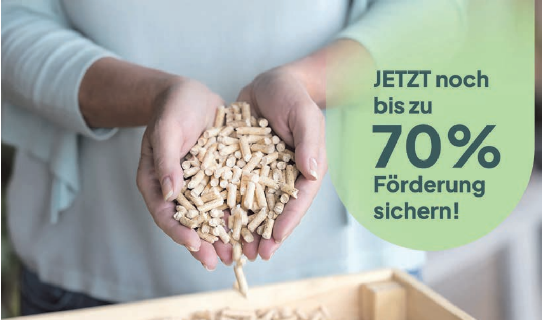
Pelletheizungen bleiben ein zentraler Bestandteil der Energiewende – aktuell noch mit bis zu 70 Prozent Förderung.

djd Noch gilt das alte „Heizungsgesetz“, nach dem ein Kesseltausch mit bis zu 70 Prozent gefördert wird. Aktuell mehrten sich jedoch politische Stimmen aus Berlin, die Förderung zu kürzen. Wer seine alte fossile Heizung gegen ein klimafreundlicheres System austauschen möchte, sollte sich deshalb jetzt noch schnell die hohen Zuschüsse von 9.000 bis 23.500 Euro im Einfamilienhaus sichern. Die Förderbeträge hängen von der Art der neuen Heizung, dem Zeitpunkt der Antragstellung, dem Emissionsausstoß der neuen Heizung und