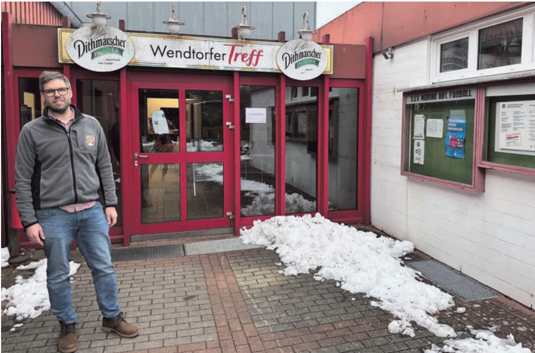
Es gibt viel zu tun – Bürgermeister Joachim Bleidiessel setzt sich für zeitgemäße Rahmenbedingungen ein.

Wendtorf (kk) Die Sportanlagen in der Gemeinde Wendtorf sind in die Jahre gekommen und sollen saniert werden. Mit knapp 500 Mitgliedern gehört der Sport- und Schützenverein zu den großen Vereinen im Kreis Plön. Der Schwerpunkt soll dabei zunächst auf dem Sportheim liegen.